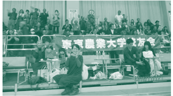
九州場所で応援する福岡県支部